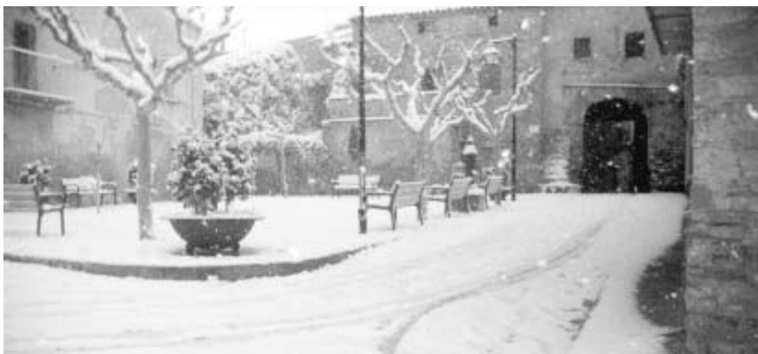
Tarroja, la plaça Nova

Encara que passa lluny de nosaltres, no sentiu un rau-rau de desencís? Tant si és el 2003, com els anys següents, volem dir que el món va més o menys bé? Però... TERRA RUBRA no vol fer figa, segueix i us desitja un Felç Any Nou, amics.