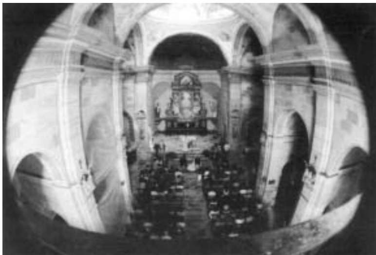
Interior de l'església de Sant Salvador de Tarroja

Si en fem una brevíssima descripció des del moment present i malgrat la gran restauració que precisa l'edifici, podem afirmar que l'església de Sant Salvador de Tarroja constitueix un dels millors exemples d'arquitectura religiosa d'època del barroc a la Segarra. Correspon al tipus d'església de planta congregacional, impulsada per la Contrarreforma per tal d'afavorir la situació dels fidels, seguint un eix direccional cap a l'altar, tot i que també s'inspira en la tradició del gòtic català. La planta, doncs, és rectangular, coberta amb volta de canó amb llunetes, amb una cúpula situada al creuer, que té la seva traducció a l'exterior amb un cimbori octogonal. L'alçat interior està definit per les pilastres que es corresponen amb els arcs faixons de la volta, pels arcs que s'obren a les capelles i la cornisa motllurada que recorre tota l'àrea perimetral del temple. Presideix la capçalera una gran petxina lleugerament còncava que esdevindrà una constant en les esglésies setcentistes i que sembla una reminiscència dels antics absis romànics.