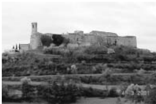
Panoràmica de Montfalcó murallat

Tornem a la plaça i pujant a mà dreta trobem cal Franquesa i cal Bargués; al fons, on comencen els porxos, cal Fraret i cal Vila; davant d'aquestes cases hi ha la sortida de la gran cisterna del poble. Després ve cal Torra; quan el carrer tomba a l'esquerra hi trobem cal Montané, cal Estasia, cal Rosinés i cal Castells; altra vegada tombant a l'esquerra i ja encarant-nos altra vegada amb la plaça, cal Estadant, cal "Niño", cal Raich i cal Gili, aquest ja tocant a la porta d'entrada.