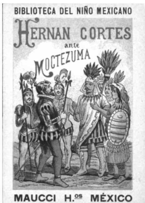
Portada d'un llibre escolar mexicà

En Moctezuma, al tenir notícies que una gent estranya havia desembarcat, va enviar-hi uns informadors, els quals li varen explicar, quan descrivien als novinguts: “alguns portaven posats uns draps vermells, i eren bonets de grana” . 34 Uns extremenys, castellans i andalusos amb barretina? Realment estranyíssim.