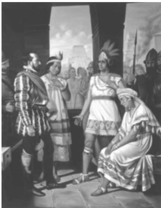
Ferran Cortès visita Moctezuma