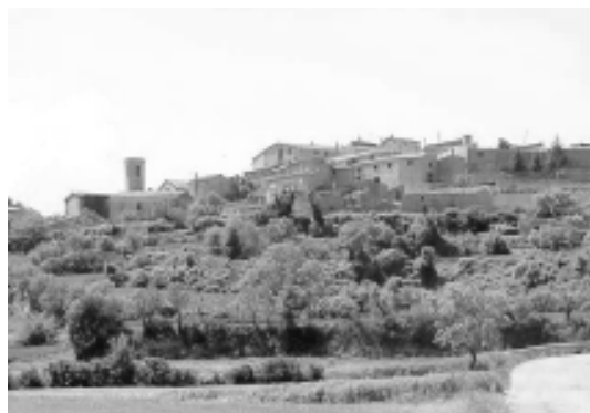
Panoràmica de Montfalcó

Un detall: si passeu el poble i seguïu la carretera que ja s'ha transformat en camí, podreu pujar fins als plans "de Montpalau" on trobareu la via del ferrocarril i el "Camí Ral". Si travesseu el Camí Ral i seguïu recte fareu