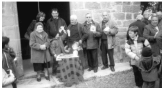
Majorals i guardonats a l'aplec de Sant Julià