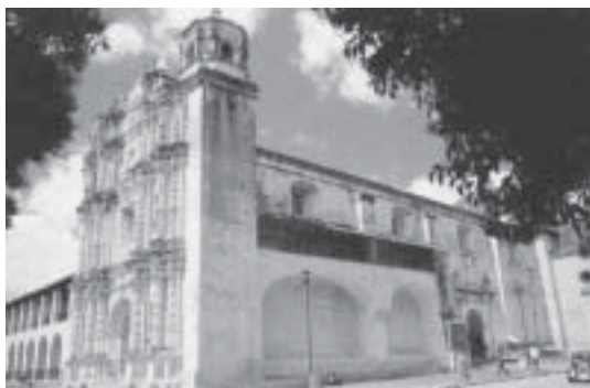
Catedral de Santo Domingo

9. Arxiu de Protocols Notarials de l'Il·lustre Col·legi de Notaris de Barcelona