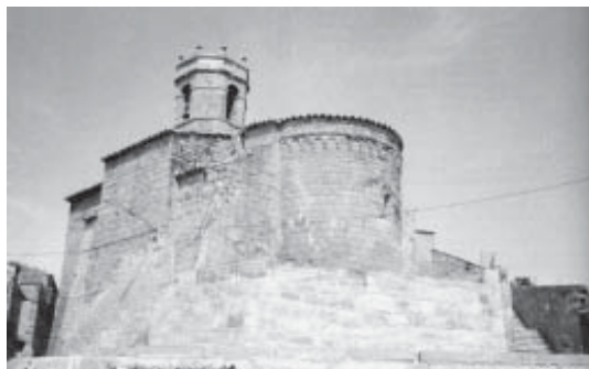
Església de Bellver de Sió

Fos com fos, Ramon II d'Anglesola era senyor d'Utxafava i de Bellver, però de manera diferent: Utxafava era una senyoria alodial o sigui en plena propietat, mentre que Bellver era, com ja hem dit,