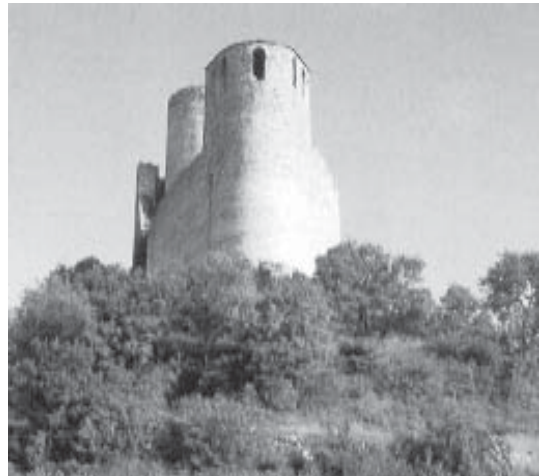
Castell de Mur (Pallars Sobirà)