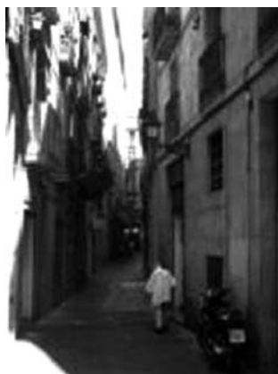
Carrer del Call, Barcelona.