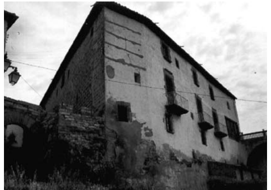
Cal Capell de Tarroja

Queda obligat lo mitger en birbar tots los sembrats de la hisenda pagant la meitat lo amo.