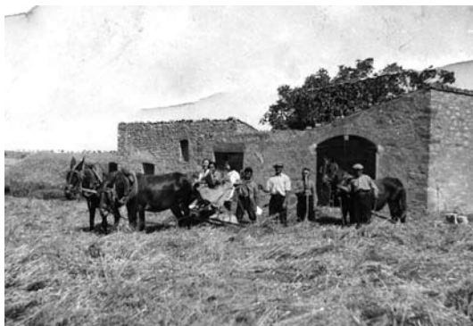
L'era de cal Valeri

Queda obligat lo mitger en haver de podary esporgar cada any la vinya y se reserva lo amo lo elegir les portadores y de fer-ho reposar, a comte del mitger si no està bé. Se obliga a dit mitger en fer tots los colgats o llaurat y capficades que se necessiten a les vinyes.