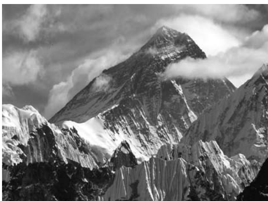
Pics de l'Himalaya (Nepal)

Llavors, recollint aquestes paraules, en William Hart, que és l'autor del