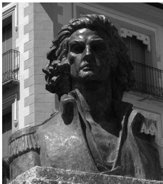
Josep Moragues i Sobrevia

nova i Comes (Moià 1660? – Sant Boi de Llobregat 1743) nasqué en el si d'una família de pagesos benestants, la qual cosa li permeté estudiar la carrera de Dret que exercí a Barcelona. Interessat per la política, passà per diversos càrrecs fins a arribar a conseller en cap de l'Ajuntament de Barcelona. La història ens advera la seva presència en els instants més dramàtics de l'assalt a la muralla del baluard de