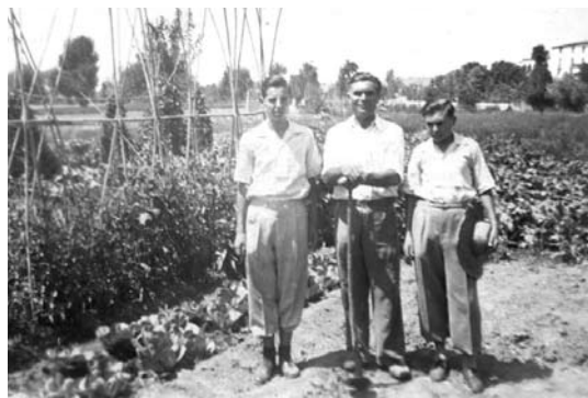
L'hort del cal Valeri

Els temps van anar canviant i la consciència del pagès també canvià. Encara que les reminiscències han arribat fins quasi els nostres temps, els contractes han anat millorant i ja fa molts anys que un contracte com el que avui reproduïm no te vigència i de mitgers en queden cada dia menys.