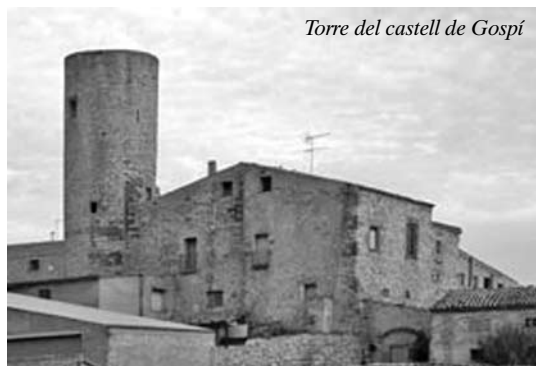
Torre del castell de Gospi

el pas pels pobles amb recorreguts diferents, han visitat castells, esglésies, cabanes, ponts, és a dir, natura i cultura a la vegada.