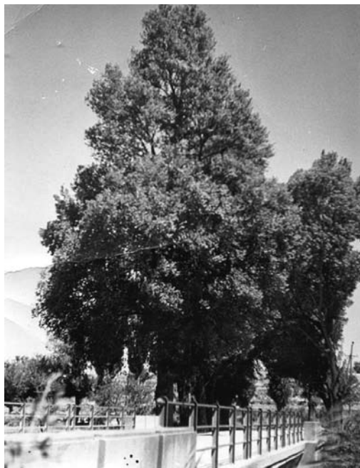
El pont gran de Tarroja

El pont gran , era llavors el límit del territori que tancava la població. Fins al pont gran ens era permès a la quitxalla anar a córrer amb la bicicleta, sempre per la vora dreta de la cuneta, per si un cotxe s'esqueia de passar. Era el camí de passeig per al jovent, agrupats en colla i sense travessar