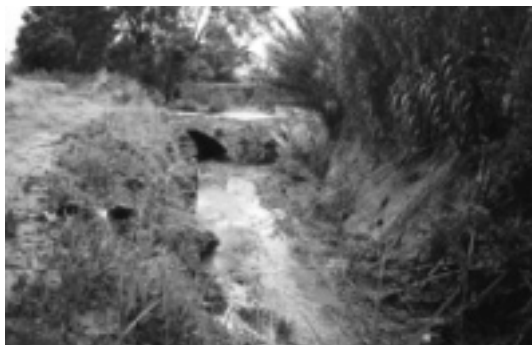
El riu Sió al seu pas per Tarroja

Ets l'hereu de la Ribera, fill de pares segarrencs has marcat aquestes terres timbrant-les amb el nom teu. Estàs acompanyat de pobles i de molts [prats de conreu. Riu Sió de gran anomenada, rajolí de porró, ens has dibuixat ta silueta com serpentina revestida de verd. No siguis tan gasiu, segarretó, engega d'una vegada aquesta aixeta tancada, així veuràs nostra rialla d'agraïment gran. Oh, si amb la teva aigua fresca i clara aquestes terres poguéssim anar regant! Són les que amb el teu nom marcares i nosaltres anem cultivant.