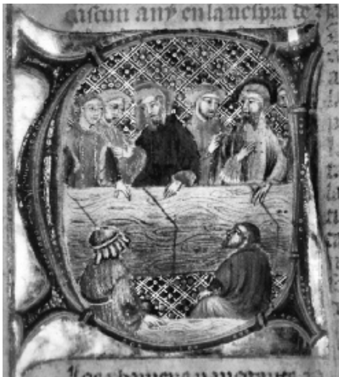
Llibre del Consolat de Mar

Pot ser d'utilitat escollir una de les institucions relacionades amb el comerç i tractar de descobrir l'extensió de les institucions, en la qual una influència distinta d'una part de tals