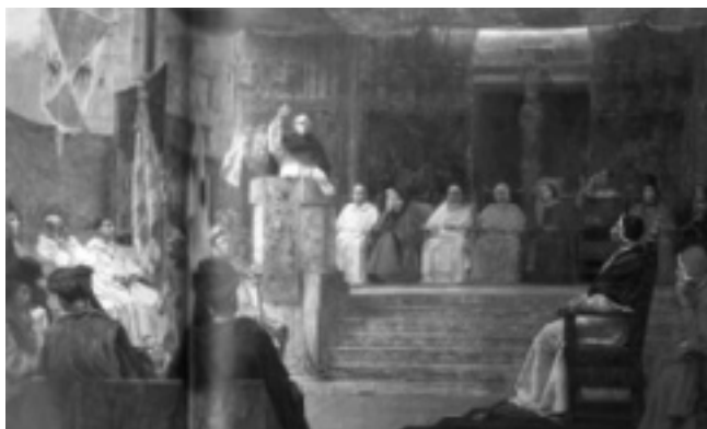
Compromís de Casp

tituï un, amb els efectes de Jaume d'Urgell, i un altre amb els propis d'en Ferran d'Antequera, només el català restà invisible. És obvi dir que el papa Benet XIII, aprofitant-se de la força moral i efectiva de la qual gaudia l'església del segle XV, es decantà incondicionalment, cap al costat d'aquest últim, anul·lant qualsevol intent dels urgellins per fer sentir la seva veu. Però, el pontífex, encara no en va tenir prou i no descansà d'intrigar fins a aconseguir que fossin els prohoms aragonesos els encarregats de designar les personalitats que havien d'elegir el nou monarca, davant la passivitat del consentiment dels polítics catalans que, novament, donaren mostra d'una manca absoluta de lideratge i de patriotisme.