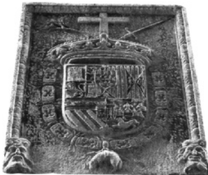
Escut de l'Inquisició

El creixement tardà d'un grup, el potencial del qual es basava fonamentalment –i no merament indirectament o parcial- sobre el comerç, una tardança tan significativa, en comparació a l'extraordinari progrés fet per la classe de comerciants, des de la meitat del segle XI en endavant, expli-