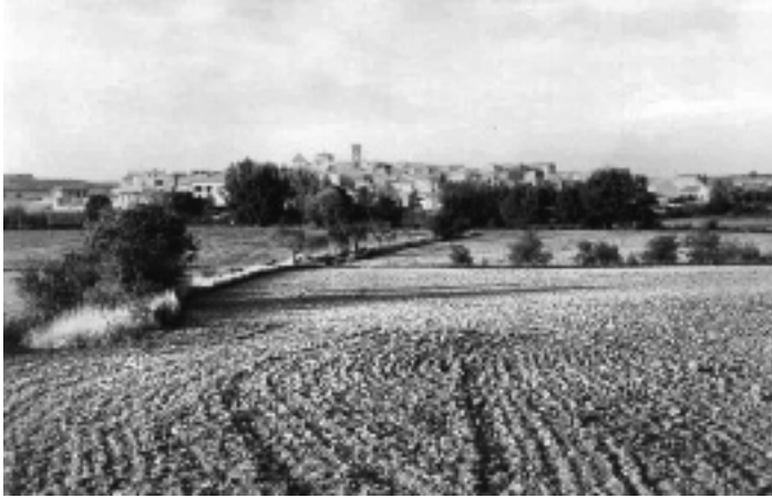
Panoràmica de Tarroja

mobles, haguts y per haver, ab totas renunciacions necessàries, degudas y pertanyents, aixís de propi for com altres, ab sumisió a qualsevol altre for, secular tant solament, y facultat de variar lo judici una y moltes vegadas, llargament. Y vol y consent que la dita (Déu volent) esdevenidora muller sua, tant quant naturalment viurà, aixís ab marit com sens marit, ab infant com sens infants, haja, tinga y possehesca la dita sua dot y creix, sens empatg ni contradicció alguna de ell ni dels seus; lo dia, emperò, del òbit de dita (Déu volent) esdevenidora muller sua la dita sua dot seguesca librement sa disposició o lo modo ab què li pertany; lo dit, emperò, creix, augment o donació per nocés sia, torne y pervinga e tornar y pervenir haja al infant o infants, id est, liberis, que del present matrimoni (Déu volent) nats y procreats seran y sobreviuran, al qual o als quals, en cas de existència de aquells, ara per lashoras, los ne fa donació pura, perfeta, simple e irrevocable que-s diu “entre vius” en mà y poder del notari dels presents capítols com a pública persona per los dits infants naixedors rebent, acceptant y estipulant. Si, emperò, tals infant o infants, id est, liberi, del present matrimoni nats y procreats no seran o seran, mes no sobreviuran, en quiscun de dits casos sia llibero y facultatiu a la dita (Déu volent) esdevenidora muller sua o bé pèndrer la mitat de dit creix y disposar-ne a sas voluntats o bé tot y usufructuar-ne tant solament, en lo qual cas