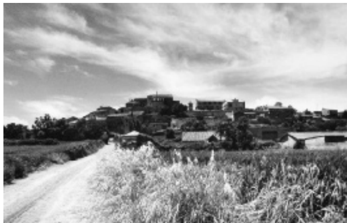
Panoràmica de la Prenyanosa

quant que quant, ab fills o fillas, id est, liberis, un o molts, legítims y naturals, y de legítim y carnal matrimoni procreats, algun dels quals arribarà a edat de testar, puga fer y disposar de totas las ditas cosas a ella desobre donadas a sas lliberas y francas voluntats. Si, emperò, morirà, quant que quant, sens los dits fills o fillas, id est, liberis, un o molts, semblants als sobre dits, o ab tals algun dels quals no arribarà a dita edat de testar, sols puga la mateixa donatària, llur filla y germana, respective, fer y disposar