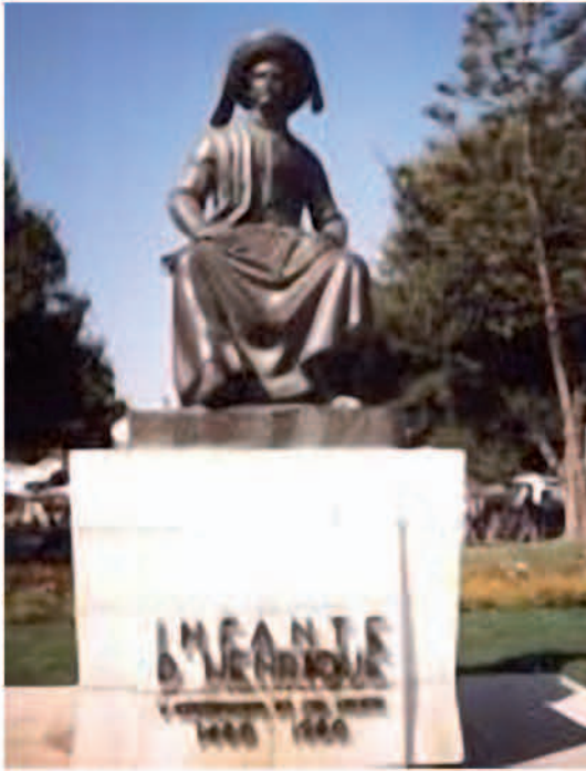
El Infante D. Henrique and Lagos.

quedat com a convenció i situa l'encontre amb fray Juan Pérez al convent de La Rábida el 1485. Si ajuntem aquesta informació deformada amb el report del pare Remon, on se'ns parla d'un portuguès de nació que escolta en Colom i després ho transmet al rei de Portugal (De Portugal? No eren a Còrdova??), veiem que, sense voler, els censors ens estan donant la notícia deconstruïda de l'arribada de l'Infant Joan de Portugal del seu viatge de preDescoberta el 1477. I aquí veiem com encaixen totes les peces de la tesi catalana: l'ambaixador Joan Colom i Bertran, esdevingut Infant de Portugal pel seu casament amb la Infanta Felipa de Coïmbra, és l'Infante João que