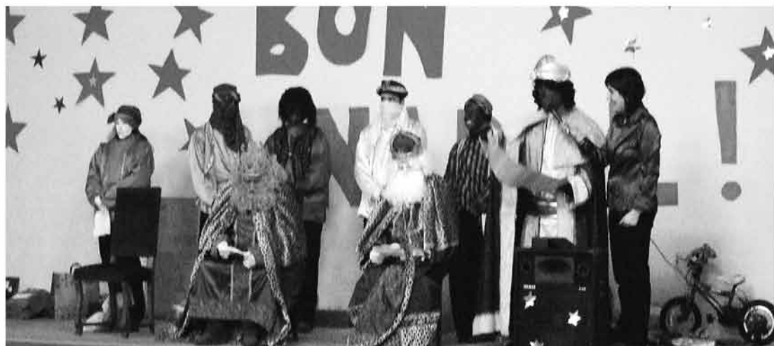
Els Reis Mags llegint el discurs després de la benvinguda de l'alcaldesa.

Però estem contents de tornar a ser aquí, tan correctes com sou.