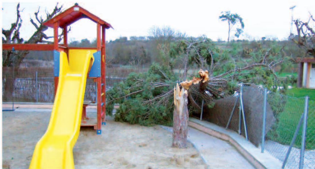
Parc d'esbarjo pels nens, proper al recinte de la piscina.

Ara ens haurem de recordar una mica més de l'aigua i del vent.