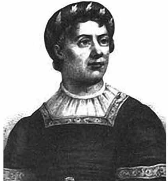
El Infante D. Pedro duque de Coimbra.

l'existència de la qual ja era coneguda, i on foren escoltats diversos testimonis que havien estat en contacte amb el gran navegant.