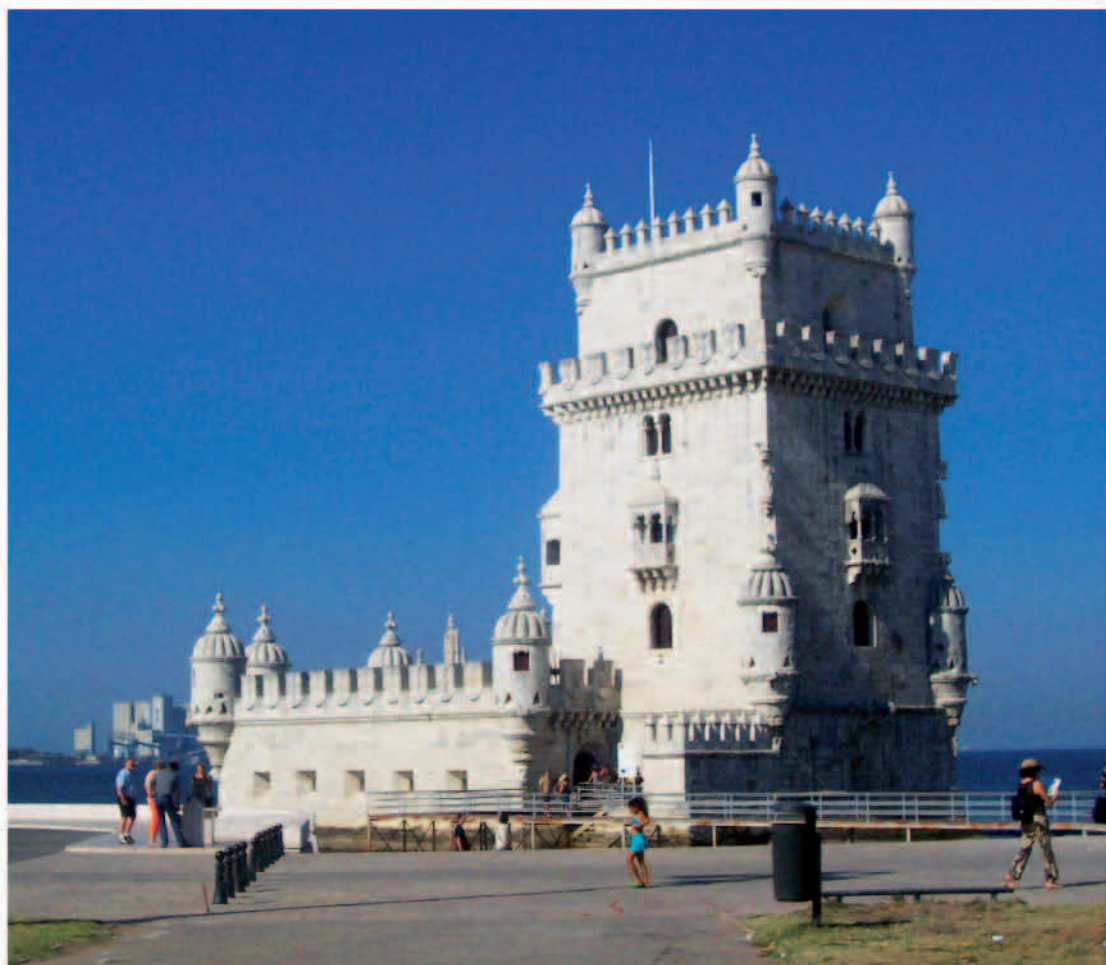
Torre de Belem (Lisboa).

gairelluny del Cap de Bona Esperança que havia descobert tretze anys abans. No s'ha trobat cap report oficial sobre l'expedició al cap. Tret del relat d'en Barros, hi ha una nota al marge de la pàgina 13 d'una còpia manuscrita de l'"Imago Mundi" del Cardenal Pierre d'Ailly, que és important ja que aquesta còpia fou propietat d'en Cristòfor Colom" 7 .