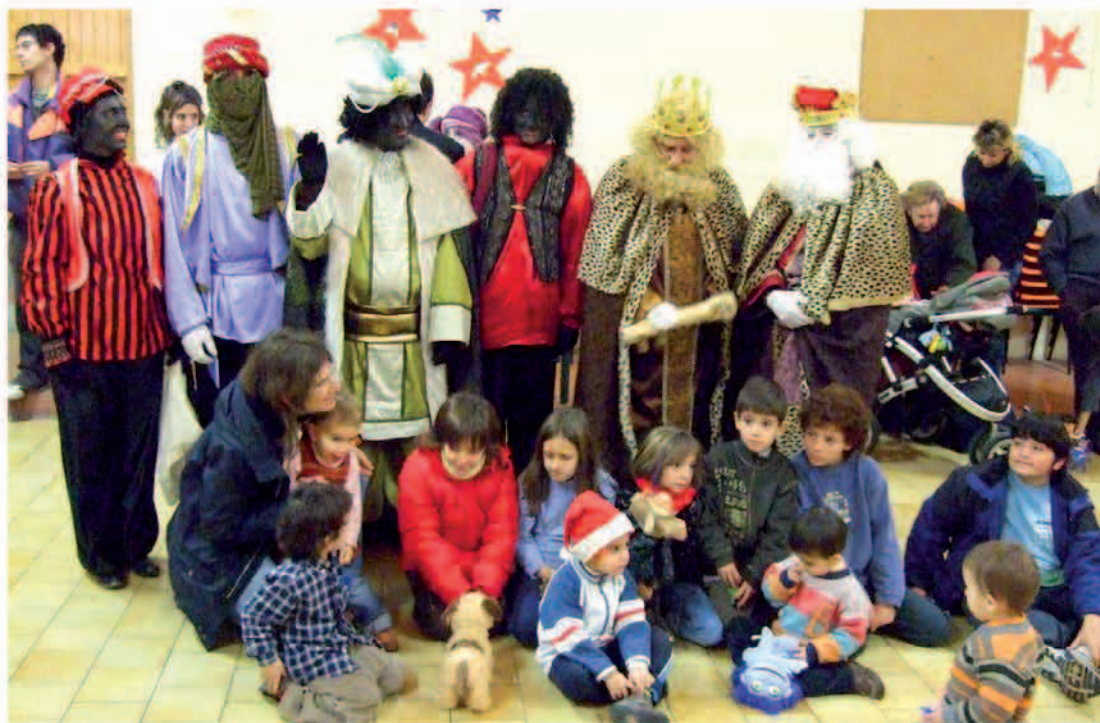
Ses Majestats, la vetlla de Reis amb els nens de Tarroja.

Agraits també, ses Majestats, del tracte rebut l'any passat.