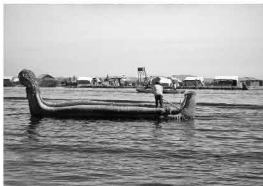
Illes flotants del llac Titicaca.

les precioses imatges que ens ha enviat, us donarem només un tast: al Machu Pichu i a les illes flotants del llac Titicaca, poc menys que un bocinet de cel.