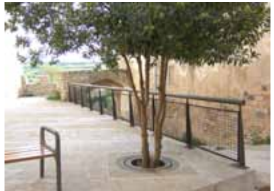
Barana restaurada a la placeta del Portal Baix