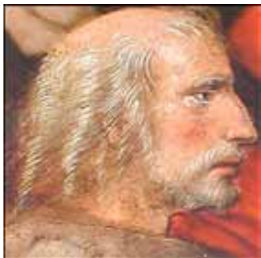
Detall del quadre La Mare de Déu dels Navegants d'Alejo Fernández, pintat entre 1505 i 1536 (Sala dels Almiralls, Reials Alcàssers de Sevilla), l'únic retrat de Colom fet amb patrocini oficial

Si prenem la interpretació literal que en Colom serví en l'empresa i conquesta de les Índies l'any 1492 a l'edat de vint-i-vuit anys —pel fet que és el 1492, i no abans, que va embarcar-se per compte dels Reis Catòlics cap al Nou Món—, ens surt un descobridor nat el 1464, de manera que el 1472 comandaria les naus que persegueixen la Fernandina a l'edat de nou anys, faria la predescoberta als tretze el 1477 i vindria a presentar el seu projecte amb vint-i-un anys el 1485. És evident que ens trobem davant d'un geni precoç en el sentit més ampli de