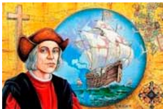
Cristòfor Colom el navegant

i-vuit anys al 1485 seria nascut l'any 1457, cosa que el fa gairebé incompatible amb el rei Renat, a qui sabem que servia el 1472 perseguint la nau Fernandina. 4 Per tal com sabem que és el mateix Cristòfor Colom qui rep la patent de cors i és a ell a qui es confia la comesa de capturar la galiassa Fernandina, 5 ens trobem que el capità dels corsaris, un