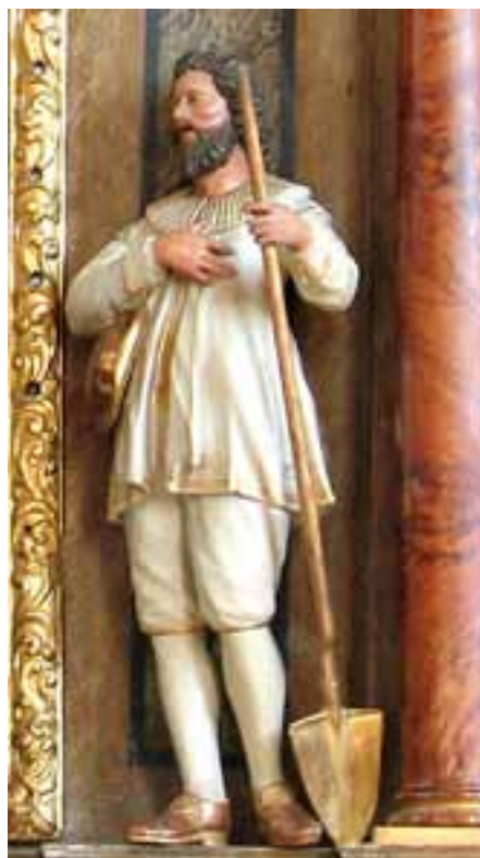
Sant Isidre, talla barroca a St. Peter bei Laien (Alemanya)

Aquest sant madrileny va restar molts anys oblidat per tothom. A finals del segle XVI sembla que el rei es va posar malalt greu. La reina va invocar l'ajut de sant Isidre i el rei es va curar. Des de llavors la devoció al sant es va estendre per arreu, sobretot en els pobles rurals. Els pagesos catalans el van adoptar per patró substituïren així els sants que fins llavors havien venerat, alguns d'ells pagesos catalans com sant Galderic, pagès rosellonès; sant Medir, pagès vallesà; sant Faust, del pla de Lleida... Queda clar allò que diu l'adagi castellà: "Quien a buen arbol se arrima buena sombra le cobija". No en faré pas cap comentari.