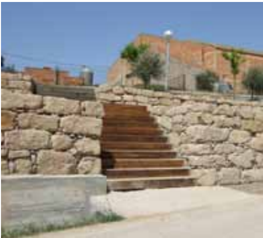
Mur acabat de reconstruir a la carretera de Cervera-Guissona

• El mur que hi havia al mateix encreuament de la carretera de Cervera–Guissona està en ferma reconstrucció, contratemps pel terreny i per l’humitat de les darreres