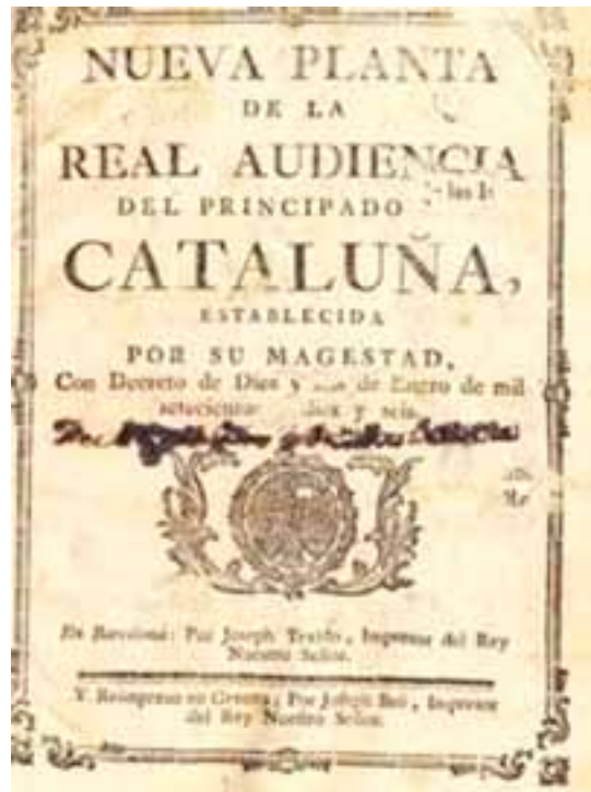
Decret de Nova Planta