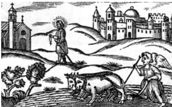
Isidre llaurador. Costumari Català, Joan Amades

Art. 2n. La Junta directora està facultada per admetre els socis que hi vulguin entrar, prèvia consulta i llicència del senyor metge.