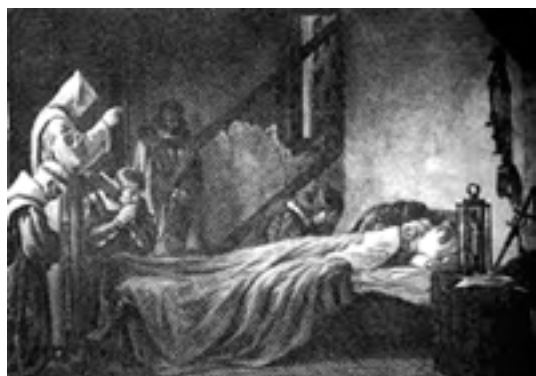
Mort de Colom

Atès que la cronologia oficial situa l'arribada d'en Colom als regnes d'Isabel i Ferran el 1485, podríem considerar que és aquesta la data en què el descobridor entrà a servir els monarques en l'empresa de les Índies i aleshores ens surt que un Colom de vint-