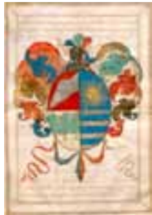
Detall del Reglament "Germandat de socorros mútuos per malalts"

Item lo Castell y la Quadra de Flix, situat en la Corregiment de Cervera, y partit de Agramunt, ab tota la heretat, y terras de tota la Quadra, herbar, delmer, y la Jurisdicció civil y criminal, alta y baixa, mes i mixt imperi, ab sa casa y molí fariner ab dos molas corrents, balsas, assequias, ayguas, conductos, peixera, y tots los arreus, y aparatos per tenir corrent