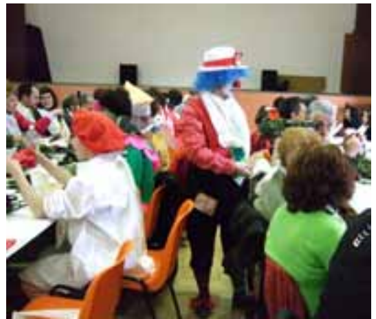
Dinar de calçotada i disfresses

• Les plaques amb l'enunciat dels carrers de la vila han estat per fi col·locades durant aquest mes de març. Alhora s'ha restaurat la barana de la placeta del Portal Baix i també