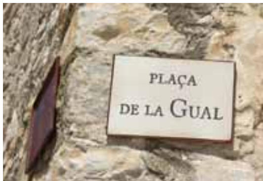
Identificació de carrers i places de la vila

la de la baixada, més sòlides i per tant més difícils de deteriorar-se. Passet a passet, que no estem en temps d'abundàncies, anem recuperant i embellint la nostra població.