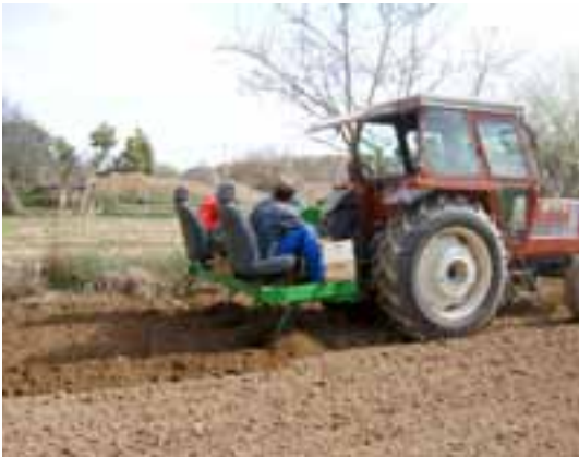
“La Garbiana Pagesa” sembrant patates

• Els joves de “La Garbiana Pagesa” en el temps marcat per la climatologia, amatents comencen a sembrar les patates, no fos cas que els de la “tele” que es fixen més amb els pagesos de les comarques barcelonines que amb els de les terres de ponent, els diguin que ho fan amb retard. Ara, no s’hi poden entretenir, diligència i nous objectius per la temporada d’estiu.