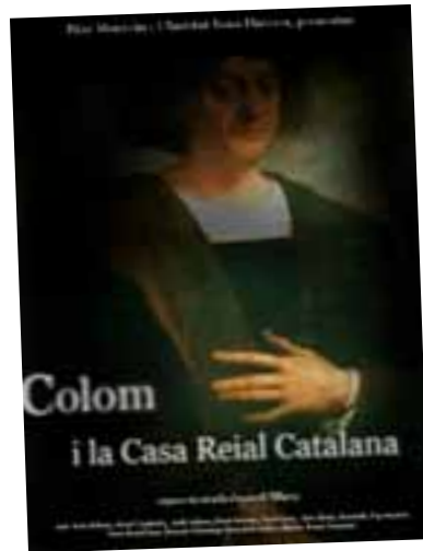
Colom i la casa reial Catalana

És possible que un estranger analfabet arribés al cim més alt de l’estructura de l’estat?