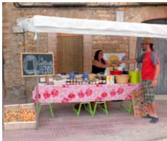
Rebost de la Garbiana