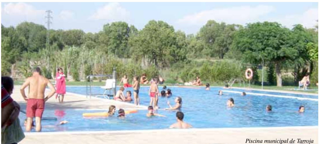
Piscina municipal de Tarroja

• Com cada any el darrer cap de setmana del mes de juny va ser inaugurada la temporada de bany a la piscina. Els dies de calor que sobtadament s'han presentat la segona quinzena d'aquest mes, han fet que el bany sigui una necessitat agradable, perquè la calor d'aquests dies, afecti menys la termoregulació del nostre cos.