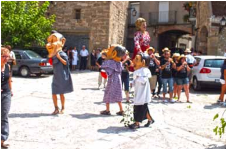
Festa Major 2011

El temps de crisi és una oportunitat que hem de saber aprofitar, el futur no és cap regal, sinó una conquesta que només guanyarem amb l'esforç de cada dia.