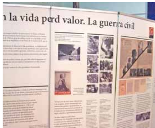
Detall de l'exposició

Diumenge dia 7 a les 12, Celebració de la Paraula a càrrec d'un seglar que col·labora a la comunitat de Mercedaris de Sant Ramon, amenitzada amb cants i participació en les lectures i pregàries de nens i assistents a la missa. Tot seguit vermut popular a la plaça Nova. Alhora es va poder assistir a l'exposició en el local de la mateixa plaça " La lluita per l'oportunitat de viure " -Les dones durant la segona república, la guerra, el franquisme i la construcció de la democràcia-