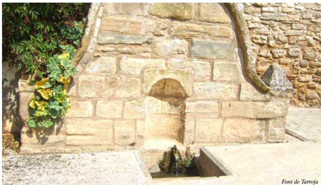
Font de Tarroja

A la Bíblia, i en tots els textos d'escrits d'altres religions, es fa ressò de que l'aigua es font de vida. Plini deia que, en 700 anys, Roma no va necessitar altre metge que l'aigua. Pasteur molts anys després manifestà que el 80% de les malalties ens les bevem. Actualment aquesta afirmació encara és vàlida, per a molts milions