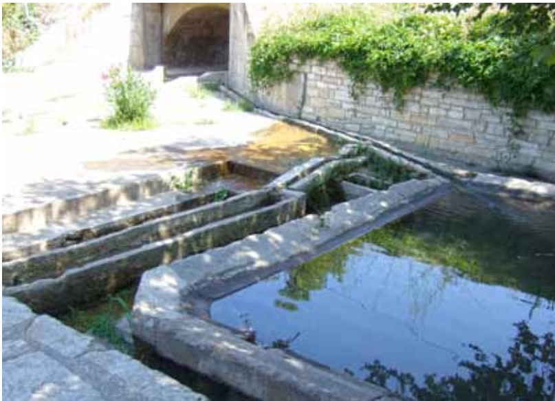
Safareig, abeurador i sèquia d'aigua

S'han d'harmonitzar els recursos i les demandes d'aigua per les diferents activitats existents i si se'n vol preveure una certa sostenibilitat, és necessària