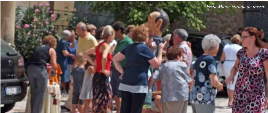
Festa Major, sortida de missa

Hem de dir que començà el dia 5 a la nit amb cinema a la fresca amb la projecció de la pel·lícula pels més petits "La història verdadera de la Caputxeta Roja" i a continuació "Entre lobos". L'assistència fou molt més que generosa, l'ajuntament en ple va estar dedicat a preparar i servir entrepans freds, calents i beguda. Una vetllada amb bona participació i satisfacció de tothom.