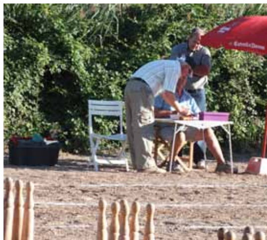
Controlador del joc de bitlles

• La "Garbiana" va voler fer acte de presència activa a la Festa i a part de col·laborar en altres activitats van sortir al carrer amb la parada d'alimentació ecològica, amb el "Rebost".