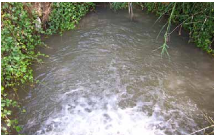
El riu Sió a Tarroja

Per això, i en benefici dels sistemes públics de sanejament, es imprescindible, mantenir i no empitjorar la qualitat de les aigües, seguint reubicant les activitats industrials en àrees de risc específic (activitats químiques, tractament i/o destrucció de residus, neteges varies) i/o altres de conflictives com la ramaderia intensiva en cicle tancat, exclouent-les d'unes àrees de protecció a millorar i/o establir, en base d'aplicar criteris específics de distribució de les activitats en el