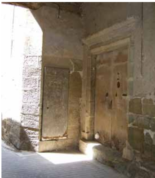
Porta de la rectoria i accés al campanar

Mentrestant, davant d'altres incidents i dificultats, que han ocorregut respecte de la rectoria, la mateixa parròquia i els locals de jovent a ella adscrits, provocats directament per l'actitud del senyor diaca, volem notificar i deixar clar: