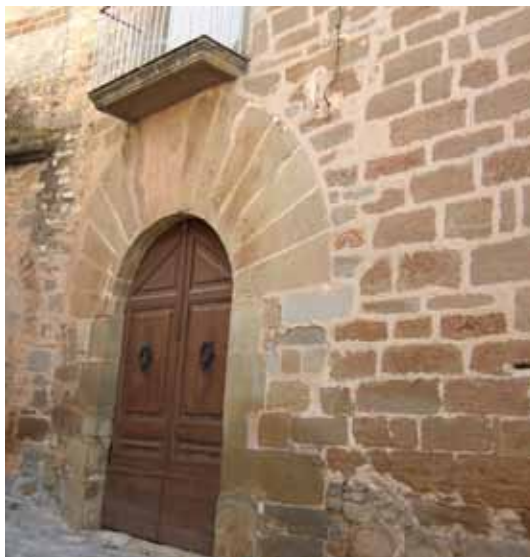
Porta principal de cal Capell