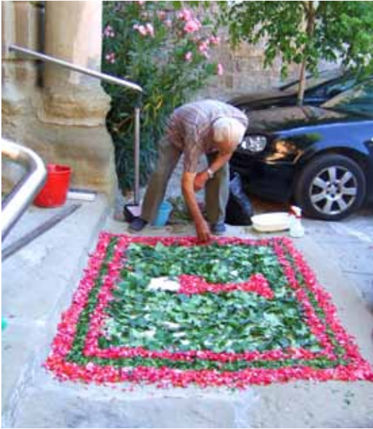
Catifa del dia de Corpus

• Diumenge dia 26 de juny, l'església celebrà la festivitat de "Corpus" a la parròquia de Tarroja, lluny de les grans celebracions que en altre temps s'havien fet, va posar el seu petit, però molt valios, gra de sorra a la festa.