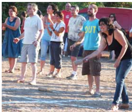
Tirada de bitlles