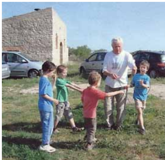
Jugant amb la rutlla