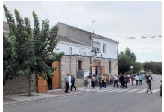
Primera Jornada Saurina

• A Tarroja es va celebrar el dia 18 de setembre, la Primera Trobada de Saurins de Catalunya. Podeu tenir-ne més informació en les pàgines següents.