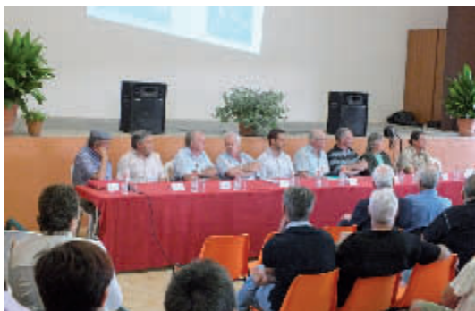
Membres que formaven part de la taula rodona