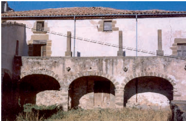
Cal Tella pel darrere de la casa, l'eixida de pedra que dona cobert al pati on es troba l'espai pels carruatges

Primer, una casa amb un portal situada al barri de Capcorral, davant l'església de Sant Antoni, valorada en 550 lliures.