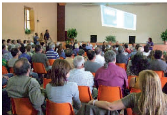
Aspecte de la sala de la vila, atents a la taula rodona de saurins

Saurins emocionats per haver tingut l'oportunitat de reunir-se, poder-se expressar. Alhora, esperançats perquè la primera jornada saurina ja té en camí una segona i confiem que moltes més al darrere.