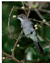
Ocell que s'emporta una llavor.

Els bancs de llavors consisteixen en llocs específics molt protegits, on s'emmagatzemen en unes condicions de màxima garantia, no solament les que tenen interès econòmic actuals i de futur, sinó també les que són menys productives o les que estan en un cert perill d'extinció. En aquests diguem-ne magatzems, amb uns nivells màxims d'estabilitat dels paràmetres ambientals, com l'humitat, la llum i una temperatura de -18°C, com a mínim, es guarden curosament les llavors.