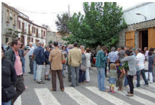
Organització de grups pels tallers