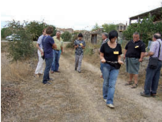
En busca de l'aigua, amb més o menys habilitat

dubtes, satisfer curiositats i obrir finestres a noves expectatives en un camp que té molt per investigar.