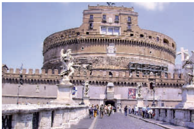
Castell San't Angelo, Roma