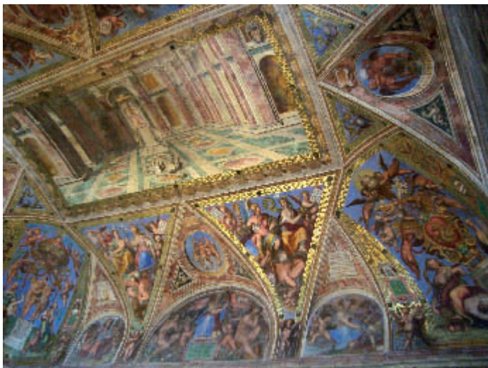
Apartament dels Borgia, Roma