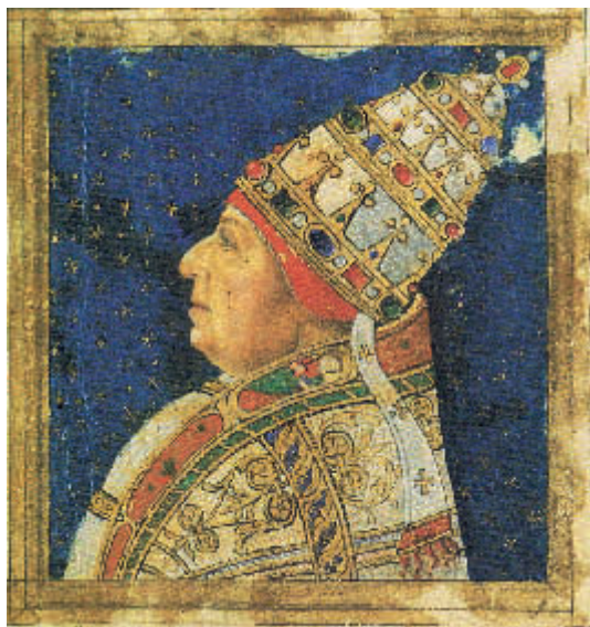
Alexandre VI, papa

(1456-1458) i Alexandre VI (1492-1503), eren de la família valenciana dels Borja i van fer del català la llengua usual de la cort pontifícia 17 .