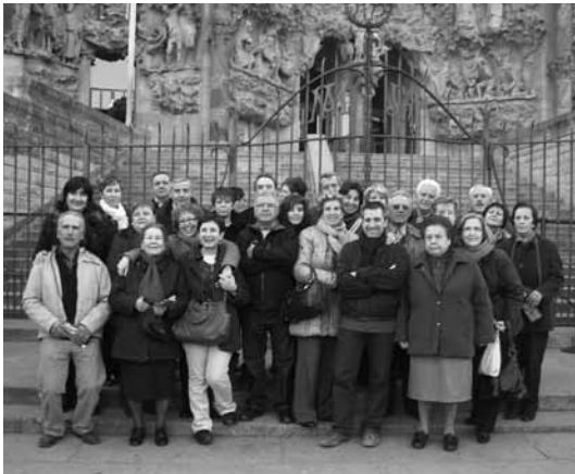
Visita a la Sagrada Família, Barcelona

• En nombre de 27, van ser els tarrogens que es van desplaçar a Barcelona el dia 11 de desembre, per visitar la Fira de Santa Llúcia i la Sagrada Família. L'excursió va ser organitzada per l'associació de dones "El Lilà".