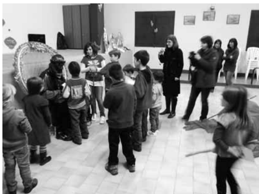
El patge reial rep els nens de Tarroja