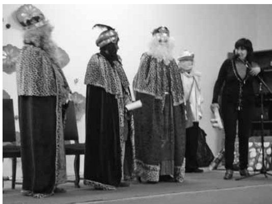
L'alcaldesa saluda els Reis i els fa entrega de la clau de la vila

En el sopar organitzat per l'ajuntament a la mateixa sala, ens vam reunir una seixantena de persones, bona part vinculades a la vila, tot i que residents en altres indrets.