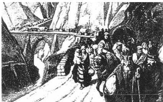
Dibuix representatiu de fugida