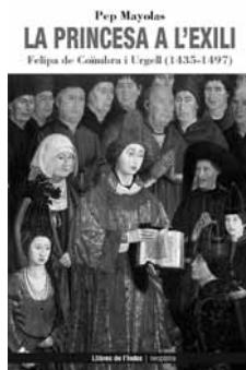
Caràtula del llibre "La Princesa a l'Exili"

L'autor és conegut pels subscriptors per les