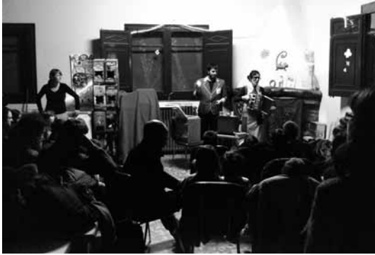
Petit espectacle per a infants al cafè de Tarroja

família, grans i petits puguin assistir-hi en temps adequat.