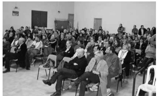
Presentació de la "Ruta de Colom Tarroja a Pals", a la sala de la vila, Tarroja

Presentació de la "Ruta de Colom" a Tarroja. Divendres 13 de gener, a les 9 de la nit. La sala de la vila plena de gom a gom, -unes 170 persones. Breu benvinguda i presentació per l'alcalde de Tarroja, dels membres de la