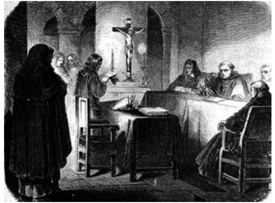
Tribunal en temps de la Inquisició