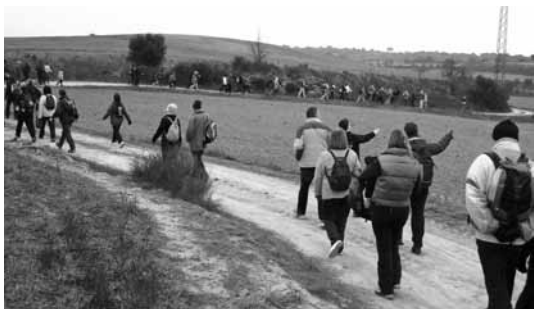
Caminants de la ruta. Camí cap a Cervera