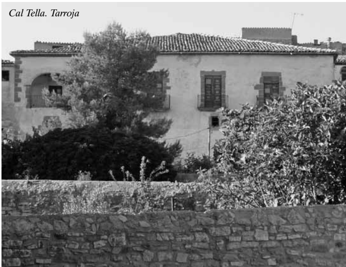
Cal Tella. Tarroja