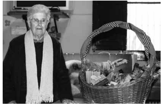
Reies de cal Talet amb la cistella de Nadal

• La cistella de Nadal, que es rifada cada any en el bar de la vila, en combinació amb el número de la ONCE del dia 22, va tocar a la Reies de cal Talet. Enhorabona!