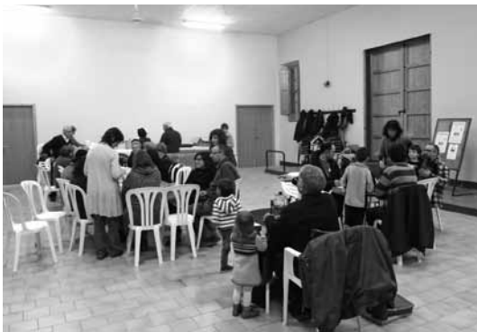
Sala de la vila. Joc de bingo i xocolatada, el dia de la Marató TV3

• Xocolatada el dia 17 de desembre per la Marató de TV3, sobre regeneració i trasplantament d'òrgans i teixits. Després de la xocolatada, joc de BINGO per a tots els assistents. L'aportació de la nostra població va ser de 400 euros.